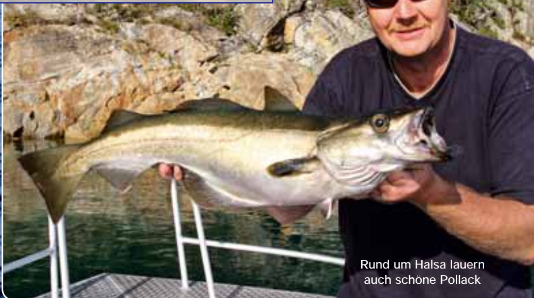
Rund um Halsä lauern auch schöne Pollack