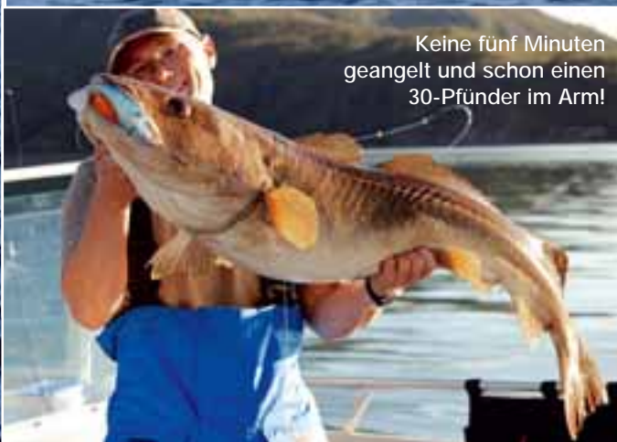
Keine fünf Minuten geangelt und schon einen 30-Pfünder im Arm!