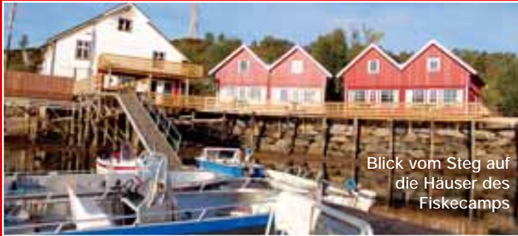
Blick vom Steg auf die Häuser des Fiskecamps

Person (Hin- und Rückfahrt) am Flughafen abholen lassen. Weitere Infos und Buchung: Din Tur, Büro West Tel. (04221) 689 05 86, Büro Ost Tel. (0351) 847 05 93, Internet www.din-tur.de