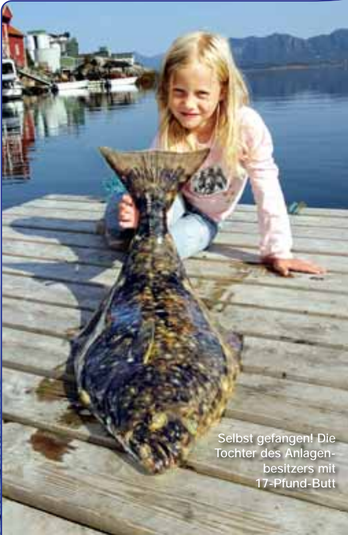
Selbst gefangen! Die Tochter des Anlagenbesitzers mit 17-Pfund-Butt

feht im Maulwinkel eines Traumforsches von über 15 Kilo. So hatte die Verzögerung in Bodø doch ihr Gutes. Dorsch bleibt auf unserer ganzen Test-Tour im August die Top-Fischart. Vor allem bei Tiefen von 40 bis 80 Metern (auch an den Stellen 1, 2 und 10) steigen noch mehrere Fische über 20 Pfund ein. Bei Traumwetter fast ohne Wind klappt es ein paar Mal sogar mit der 80-Gramm-Rute und 70 Gramm-Pilker.