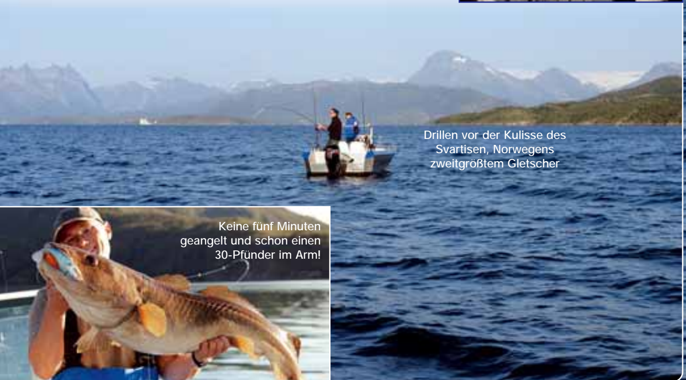
Drillen vor der Kulisse des Svartisen, Norwegens zweitgrößtem Gletscher