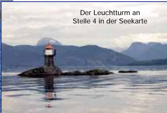
Der Leuchtturm an Stelle 4 in der Seekarte

zu lachen: Von unten setzen ihnen neben Unmengen großer Makrelen die Köhler übel zu. Und die werden immer größer. Fische über 15 Pfund landen in unseren beiden Booten. Doch die ganz Großen verpassen wir: Gunnar, gute Seele der Anlage, hat mit seiner Handleine und roten Gummi-Makks deutlich mehr Glück und fängt vier Köhler-Brocken zwischen 10 und 14 Kilo! Da bleibt für mich eine Rechnung offen, denn einen richtig großen „Schwarzen“ hab ich noch auf der Wunschliste. Halsä ist auf jeden Fall eine gute Adresse für alle, denen es ähnlich geht. Und das Angeln dort findet vor einem grandiosen Panorama statt: Der Svartisen, zweitgrößter Gletscher Norwegens, leuchtet selbst im Hochsommer von den Bergen und wäre eigentlich auch einen Ausflug wert gewesen. Aber bei der exzellenten Fischerei rund um Halsä konnten wir uns nicht dazu durchringen, einige Stunden Angelzeit abzuwacken. ▶